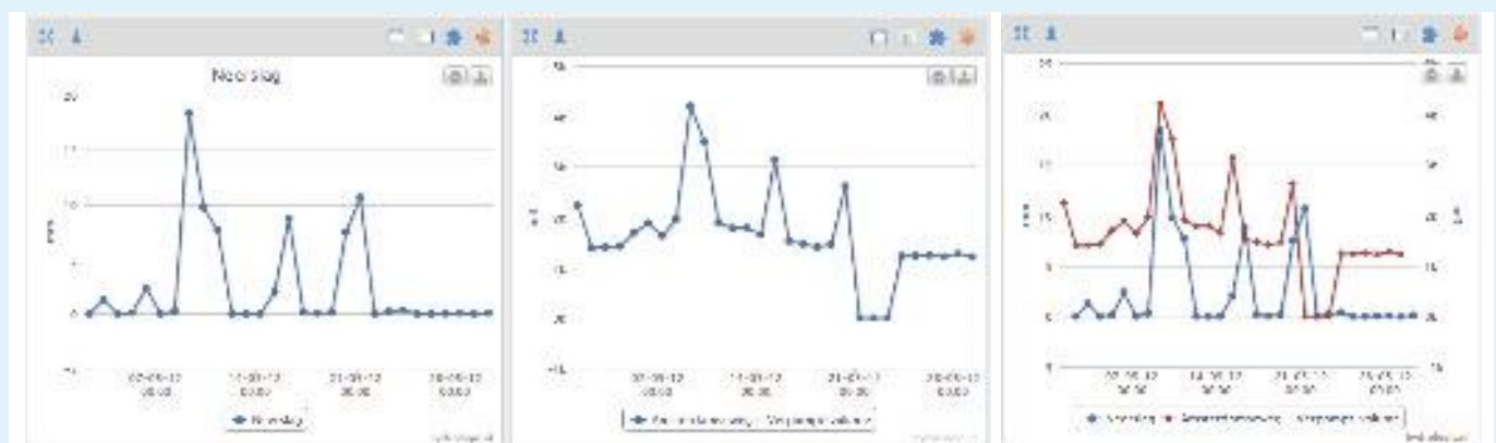
Afb. 2: Selecteren van gegevens van datasets (links) en het zelf combineren tot één grafiek (rechts).

Daarnaast heeft de gemeente Amersfoort een aantal toepassingen tot haar beschikking, zoals het vergelijken van gevallen neerslag met normbuien, het automatisch genereren van een waarschu-